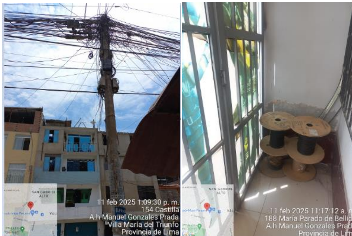
Fuente: Acta de fiscalización del 11 de febrero de 2025