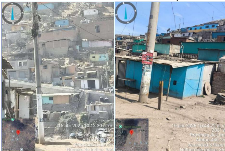
Gráfico N° 15: Zonas de cobertura del servicio ofrecido por San Gabriel