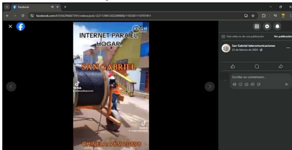
Gráfico N° 11 Imágenes obtenidas de la red social