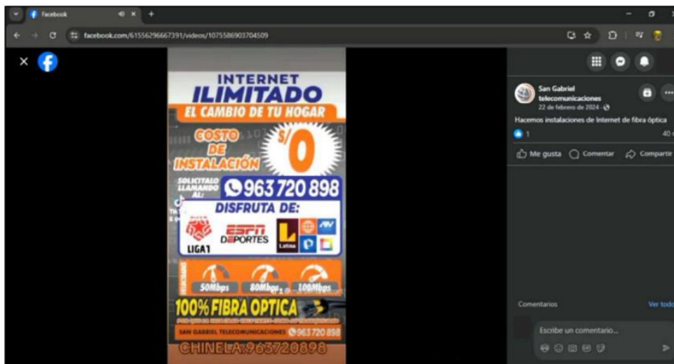
Gráfico N° 6 Imágenes obtenidas en la red social Facebook