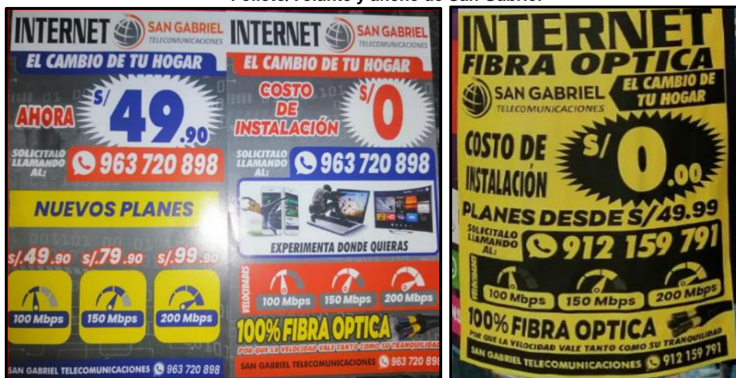
Gráfico N° 2 y N° 3 Folleto/Volante y afiche de San Gabriel

Fuente: Escrito N° 1 (registro SISDOC 80478-2024/MPV), remitido por Telefónica.