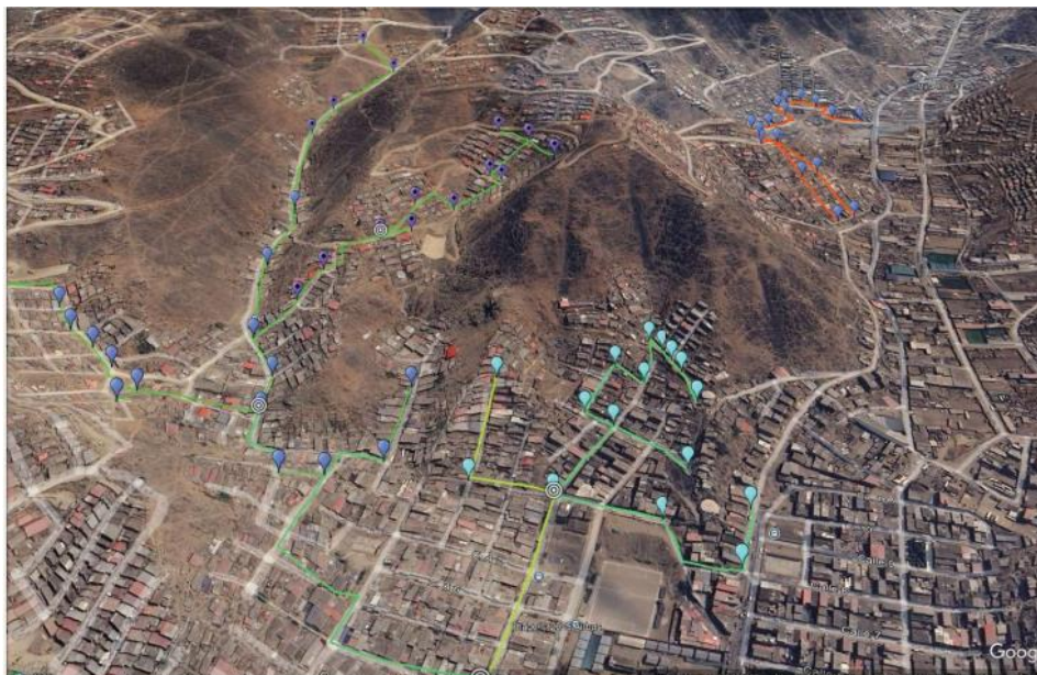
Gráfico N° 16 Área de despliegue de fibra óptica por parte de San Gabriel