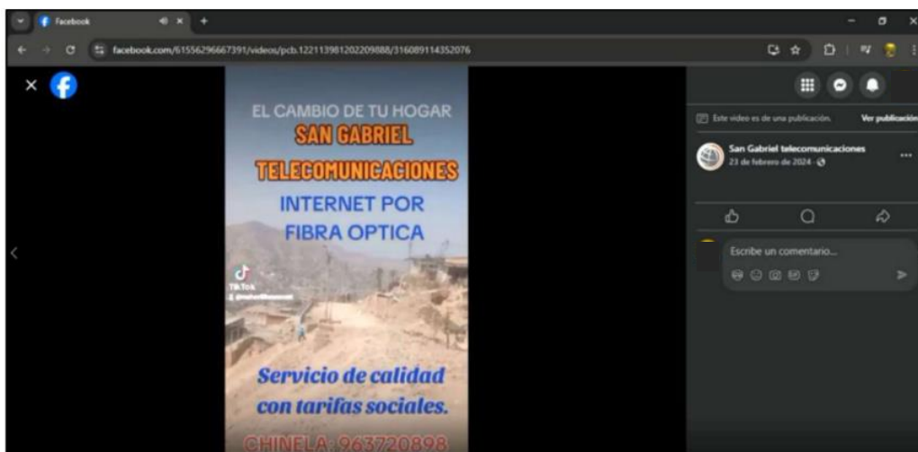
Gráfico N° 7 Imágenes obtenidas en la red social Facebook