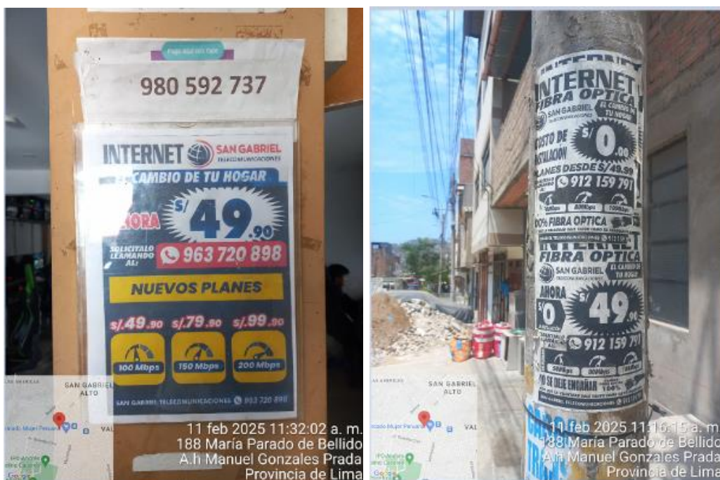
Gráfico N° 4 y N° 5 Afiches identificados en la acción de fiscalización del 11 de febrero de 2025