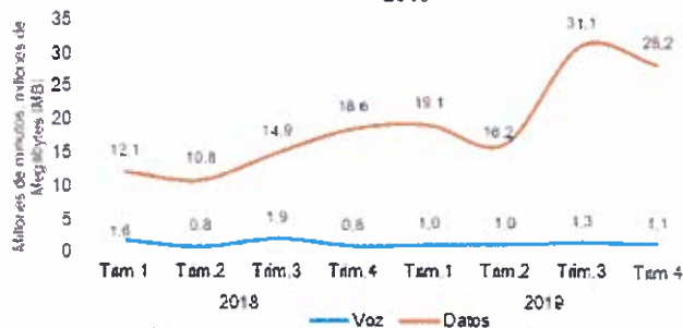
Gráfico N° 8: Tráfico de voz y datos generado usuarios por usuarios peruanos en Chile, 2018-2019