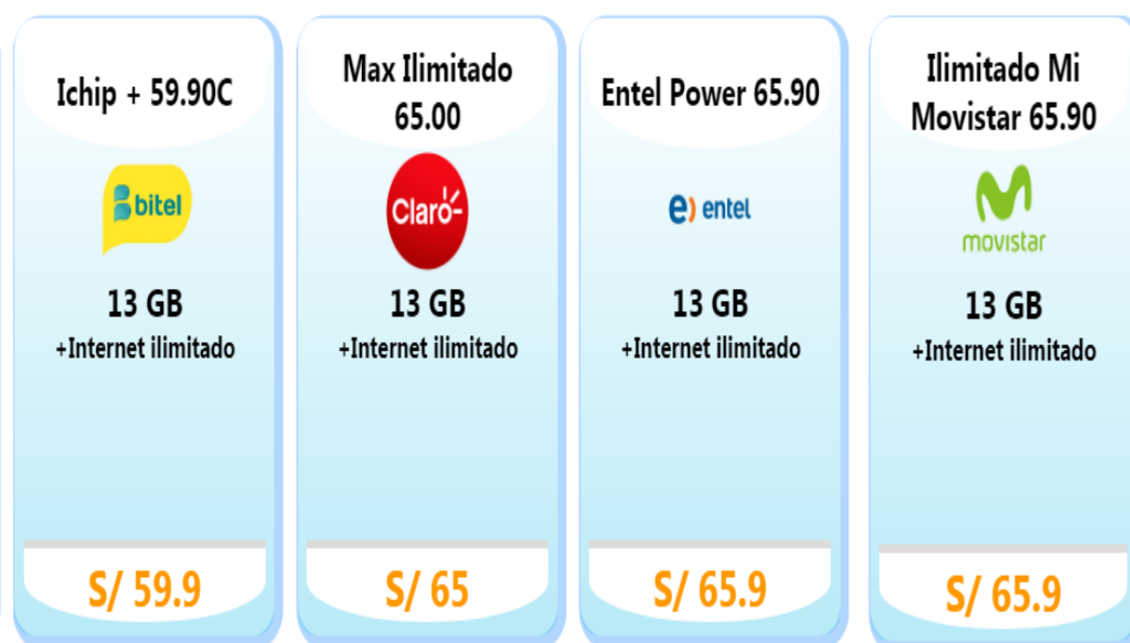
Grafico N° 1: Planes tarifarios que incluyen servicio de Internet ilimitado

Información verificada al 22 de julio de 2020