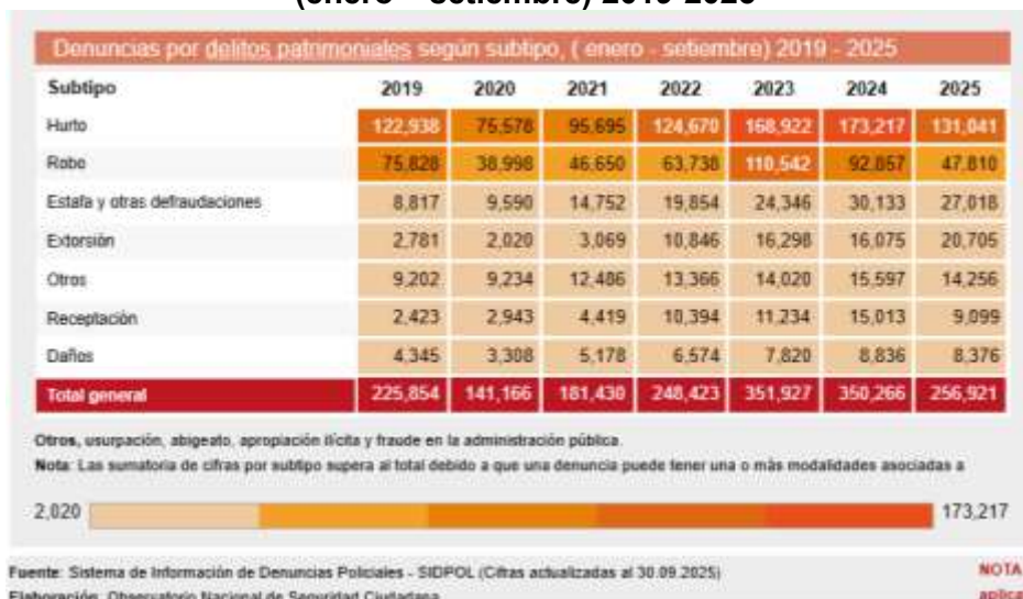
Cuadro N° 05: Denuncias por delitos patrimoniales según subtipo, (enero – setiembre) 2019-2025

De acuerdo con la información del Observatorio Nacional de Seguridad Ciudadana 8 , la incidencia del delito de extorsión registra un total de 20 705 hechos reportados a la Policía Nacional del Perú entre enero y setiembre del año 2025. Asimismo, se advierte un crecimiento de 29% respecto del mismo periodo del año 2024.