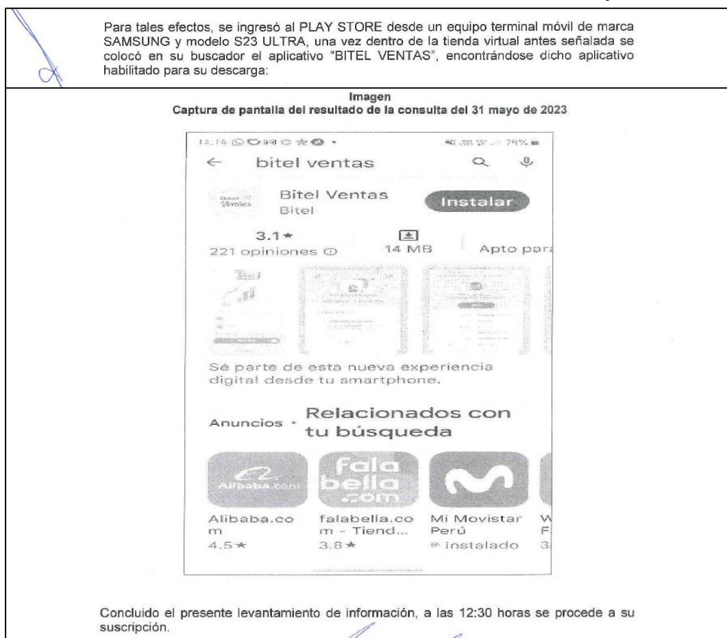
Gráfico N° 1 Extracto del Acta de Levantamiento de Información de fecha 31 de mayo de 2023.