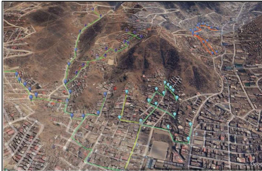
Gráfico N° 3: Área de despliegue de fibra óptica por parte de San Gabriel