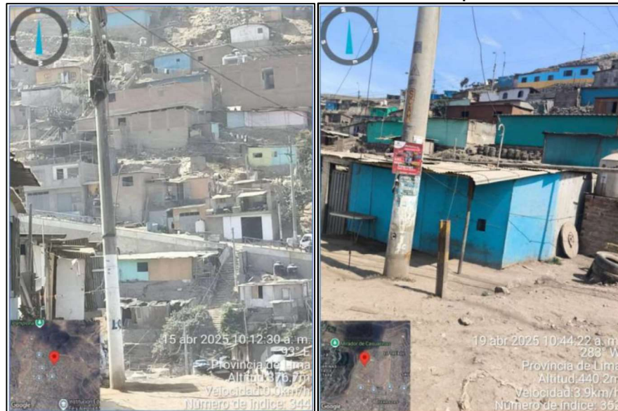
Gráfico N° 2: Zonas de cobertura del servicio ofrecido por San Gabriel